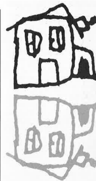
I disegni sono di Gianfranco Zavalloni

Ecco gli obiettivi principali del campo: assieme possiamo individuare, e poi seguire, delle strade di liberazione che partano dalla nostra vita e arrivino a quella dei ragazzi. ■