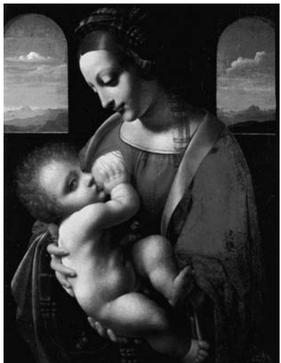
LEONARDO DA VINCI Madonna del latte – tempera su tavola, Lombardia 1490 oggi al- l'Hermitage

Il dipinto della Madonna Litta, attribuito a Leonardo ma probabilmente eseguito dagli allievi, è certamente uno dei più delicati ritratti della Madonna del latte. Qui la misericordia diventa tenerezza, ma anche nutrimento di vita: lo sguardo è un elemento fondamentale e ci ricorda che la misericordia è sempre relazione, implica la presenza dell'Altro.