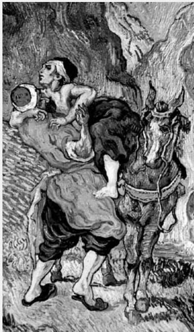
VINCENT VAN GOGH Il buon samaritano – olio su tela, 1890

Per questo quadro Rembrandt si ispira alla parabola del Figliol prodigo, ricordata anche come “Parabola del padre misericordioso”. Qui la misericordia diventa perdono di chi ha il coraggio del pentimento. L’abbraccio del padre è amorevole e protettivo. Interessante un particolare: le mani del padre non sono uguali, ma sono una maschile e una femminile: Dio è nostro Padre, ma anche nostra Madre. È tutto.