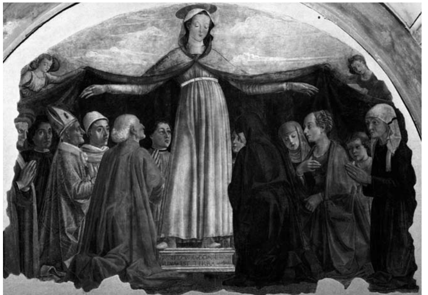
GHIRLANDAIO – Madonna della misericordia affresco, Firenze 1472

Forse una delle più note immagini della Madre di misericordia, con largo mantello ad accogliere e proteggere i fedeli che la circondano inginocchiati. Sul gradino su cui poggia i piedi si legge: “Misericordia Domini plena est terra” (La terra è piena della misericordia del Signore). S. Oddone, abate di Cluny nel X secolo, è il primo che utilizza il termine “Madre di misericordia” riferito a Maria, che è madre clemente e tenerissima e ha generato Gesù, misericordia visibile di Dio.