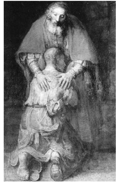
REMBRANDT Ritorno del figliol prodigo Amsterdam 1668

Per questo quadro Rembrandt si ispira alla parabola del Figliol prodigo, ricordata anche come “Parabola del padre misericordioso”. Qui la misericordia diventa perdono di chi ha il coraggio del pentimento. L’abbraccio del padre è amorevole e protettivo. Interessante un particolare: le mani del padre non sono uguali, ma sono una maschile e una femminile: Dio è nostro Padre, ma anche nostra Madre. È tutto.