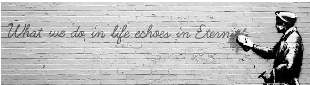
BANSKY – murali – quartiere Queen a Londra

tro l’ergastolo, “pena di morte occulta” al pari o quasi delle pene che “comportano per il condannato l’impossibilità di progettare un futuro di libertà”. Nella Bolla di indizione (11 aprile), richiamando le parabole del servo crudele e del figliol prodigo, identifica chiaramente la vera giustizia cui tendere; nella lettera di concessione dell’indulgenza (1 settembre) tocca il tema di una “grande amnistia”, paragonando la porta di ogni cella ad una Porta Santa da attraversarsi – in ingresso come in uscita! – da parte di detenuti e non (pensiamo alla Polizia Penitenziaria, al personale che amministra e dirige le case di reclusione, ai volontari che vi prestano la loro opera) “perché la misericordia di Dio, capa-