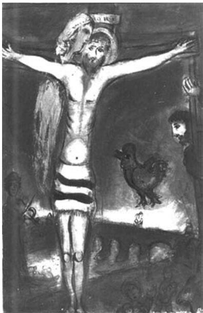
MARC CHAGALL La crocifissione bianca - olio su tela, Art Institute Chicago, 1938

Un Cristo vergognoso più che sofferente ricoperto con il tallit, lo scialle da preghiera ebraico, circondato da un quadro di violenza e devastazione dove tutti i personaggi umani sembrano troppo occupati a fuggire per occuparsi di lui. "Padre perdona loro, perché non sanno quello che fanno" (Lc 23,34). Anche quando tutto sembra crollare, risuona la parola di Gesù: perdonare per essere perdonati, usare misericordia per trovare misericordia.