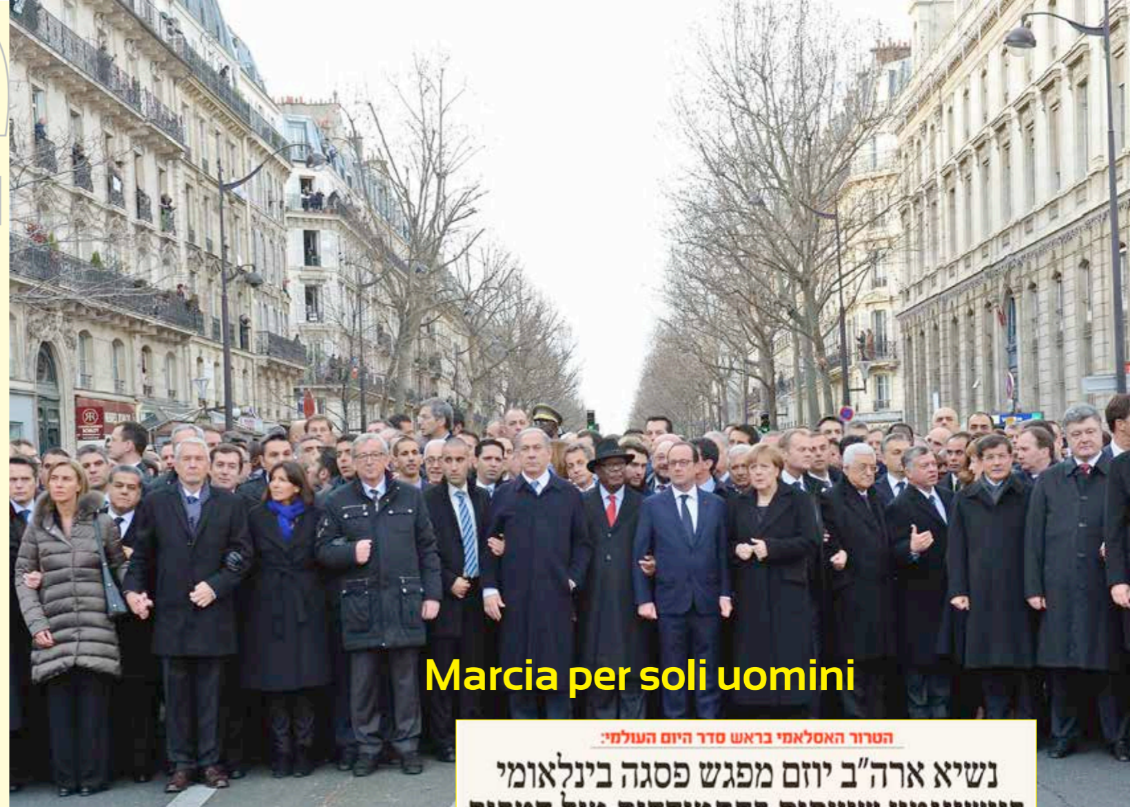
Marcia per soli uomini

Alzi la mano chi non si è mai allarmato per un avvertimento falso, che ha fatto rimbalzare prima di accorgersi che era una bufala? La fotografia per noi è sempre un fatto (e in questo sbagliamo). Ma se è alterata si tratta sicuramente di un'opinione. Quindi il fotoritocco andrebbe vietato per legge? No, si tratta di uno strumento: dipende da come e dove viene utilizzato. Nel giornalismo (e ancor di più nel fotogiornalismo) non è ammessa alcuna modifica. Nascondere o non mostrare sono modi per tradire il patto di onestà con i lettori. Nel ritratto o nella fotografia di matrimonio invece ci si può permettere di attenuare alcune imperfezioni o inestetismi. Si tratta già di immagini realizzate deliberatamente, con-