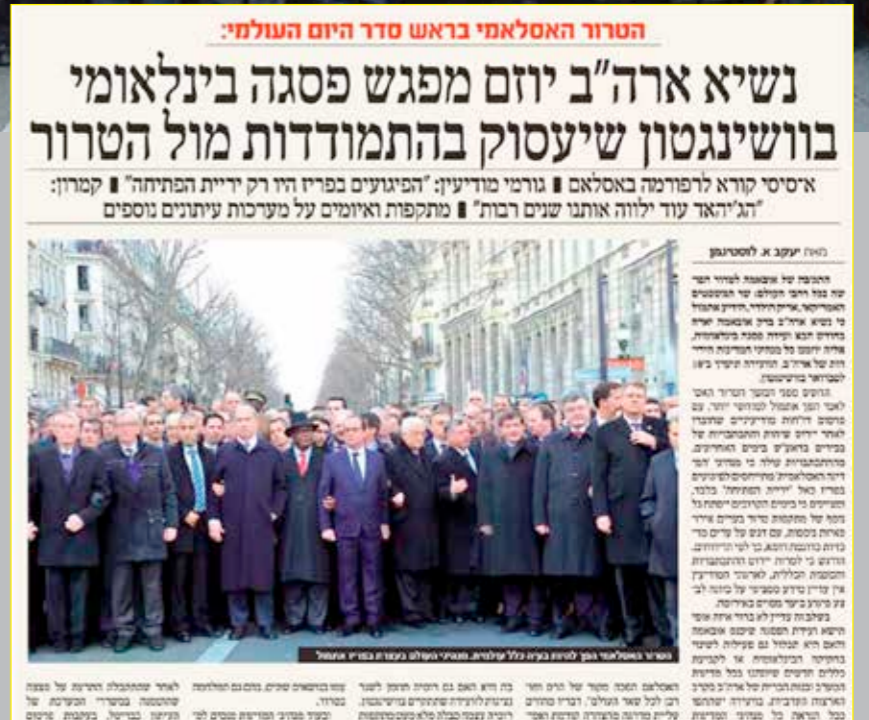
Un quotidiano ultra-ortodosso israeliano rimuove le donne premier dalla foto di una marcia a seguito dell'attentato a Charlie Hebdo nel 2015. Immagine pubblicata dal giornale HaMvaser. fFoto originale (foto di Haim Zach / GPO).

sapevolmente. Entro certi limiti fa parte del gioco. Nella pubblicità, nelle illustrazioni, nella fotografia artistica invece è ammesso tutto. Come si smascherano le fake news? Il sistema principale è risalire alle fonti, controllare l'origine, confrontare il fatto come riportato da più osservatori diretti. Non tutte le fonti però sono ugualmente affidabili. Testate giornalistiche importanti, canali ufficiali, soggetti sociali di lunga tradizione (come alcune Ong internazionali) metterebbero a rischio la loro reputazione se pubblicassero notizie false, quindi sono i primi a fare un controllo accurato dei fatti prima di pubblicare le notizie. A volte il nostro like aggiunge peso ad una bugia, che poi fatica ad essere smascherata. Pensiamoci prima!