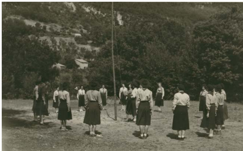
Alzabandiera al campo di Riparto, Trentino, anni '60

Il Consiglio straordinario ebbe luogo la sera del 28 aprile.