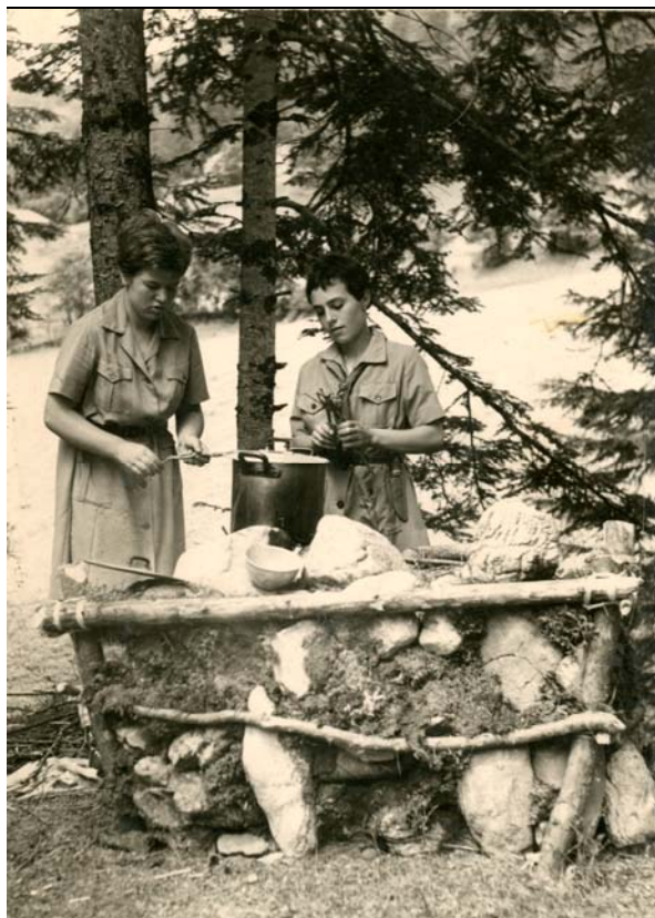
Cucina al campo, anni '60

A stampa: sacerdote Leopoldo Cucchiara, Lettera aperta... , Comitato provinciale amici degli scouts e delle guide, Agrigento, 1963.