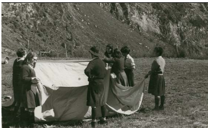
Montaggio della tenda di Squadriglia, Campo di Riparto, Trentino, anni '60