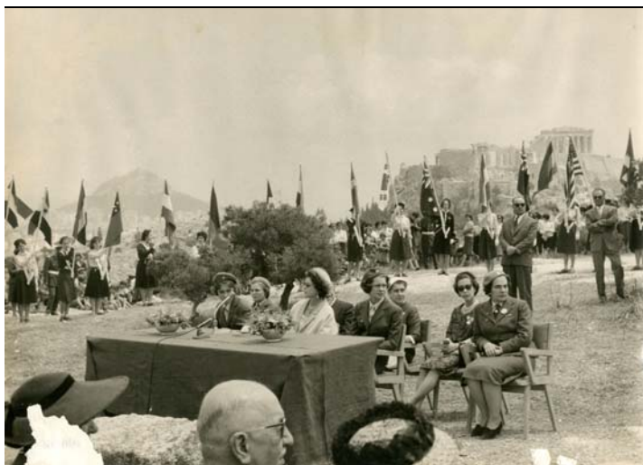
Conferenza mondiale Waggs, Atene, maggio 1960; al centro la regina Federica di Grecia e alla sua sinistra la principessa Sofia