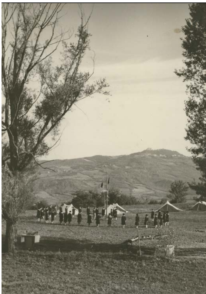
Alzabandiera a un campo di formazione per Capo Agi, anni '50

Circolari e corrispondenza della squadriglia nazionale formazione capi.