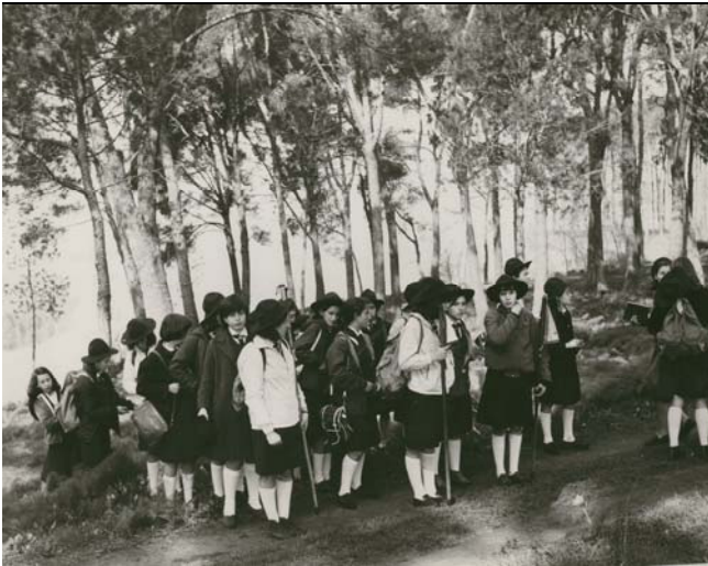
Uscita di Riparto, Lazio, anni '60