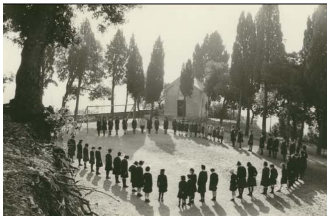
Guide in quadrato, anni '60

Corrispondenza, materiale illustrativo e relazioni relative ai rapporti con altre associazioni e enti; si segnala: documento presentato da Agi, Asci e Masci all'incontro diocesano del 12-15 febbraio 1974, sul tema "La responsabilità dei cristiani di fronte alle attese di carità e di giustizia nella Diocesi di Roma".