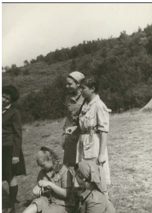
Guide in uniforme da campo, primi anni '60

Contratto con La Rinascente per la fornitura di vestiario ai soci Agi, corrispondenza con La Rinascente, il Banco di Roma e padre Dupuich degli Oblati di Maria Immacolata per la gestione legale e finanziaria del contratto.