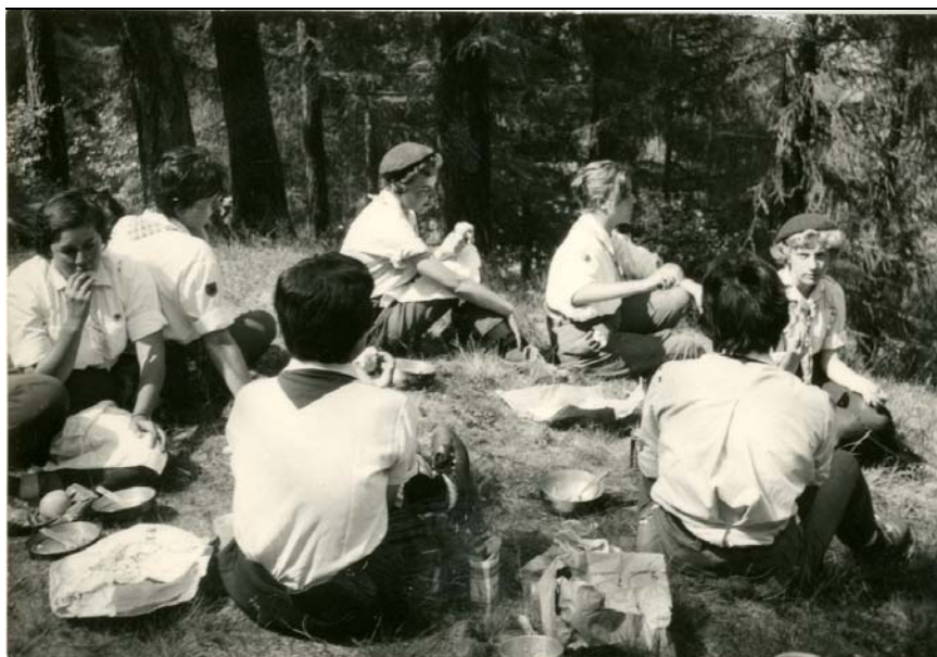
Scolte in route, pausa, Trentino, anni '60