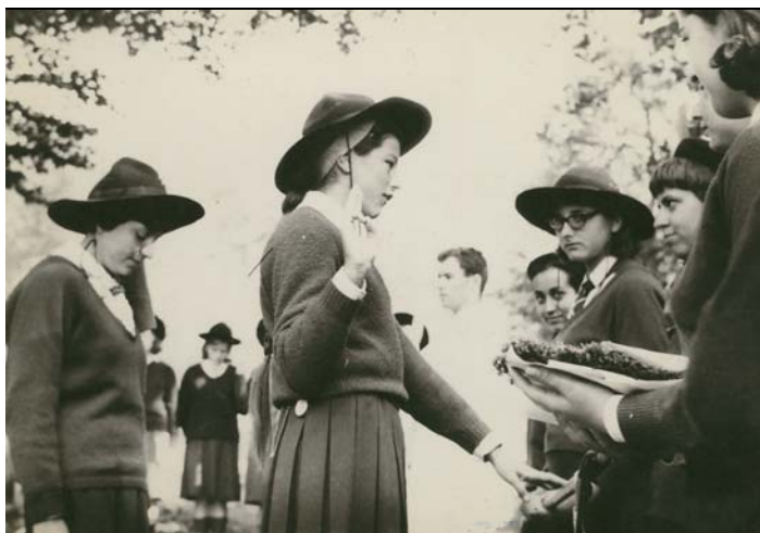
Cerimonia della Promessa, Riparto di Roma, fine anni '60

La sezione conserva la documentazione relativa ai consigli generali dell'Associazione, a partire dal primo, tenutosi nel 1946 all'ultimo del 1973 che sancì l'unificazione all'Asci e la nascita dell'Agesci.