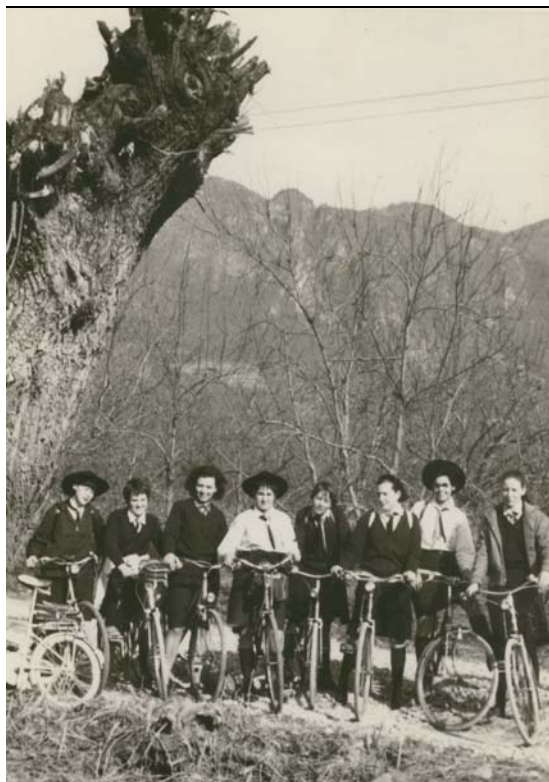
Uscita di Squadriglia in bicicletta, Lazio, anni '60

Il testo " Girl Guiding ". Guidismo per ragazze , è stato pubblicato in Italia, in altra traduzione, come allegato al n. 155 della rivista «Esperienze e Progetti del Centro studi ed esperienze scout Baden-Powell», anno XXXII, gennaio-febbraio 2005. La traduzione conservata nell'Archivio Agi, probabilmente opera di monsignor Desiderio Nobels, autore anche della trascrizione, è inedita. Una copia anastatica del Manuale è conservata nel catalogo della Biblioteca del Centro di documentazione Agesci.