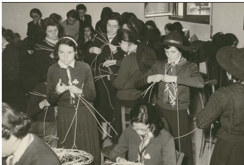
Attività manuali del raduno Alte Squadriglie MT, Roma, 1957