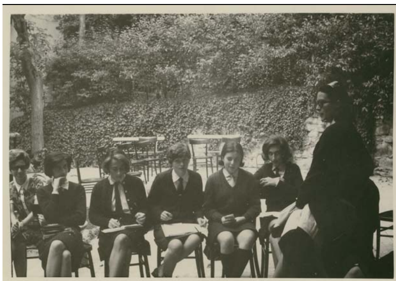
Lavori di gruppo, Assemblea nazionale delle Capo Agi, Villa Mondragone, 1971