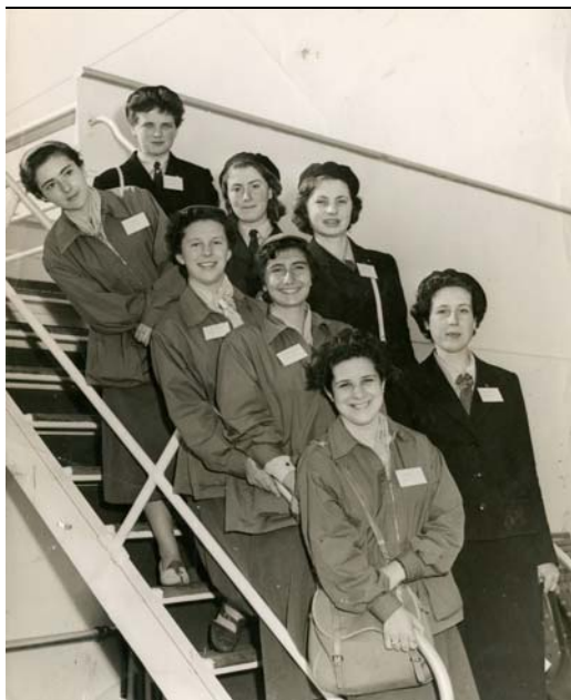
Scolte Agi e Cngei in partenza per gli Usa per attività Juliette Low, anni '60

na; materiale campi scuola; schede cronologia avvenimenti Agi; relazioni di campi all'estero (Palestina, 1968, con 3 foto b/n raffiguranti scolte e scout arabi e Alsazia, 1970); Carta cattolica del guidismo; Statuto Agi; relazioni relative a incontri internazionali; "Appunti per lezioni sullo scautismo nei seminari" di padre Lorenzo Del Zanna.