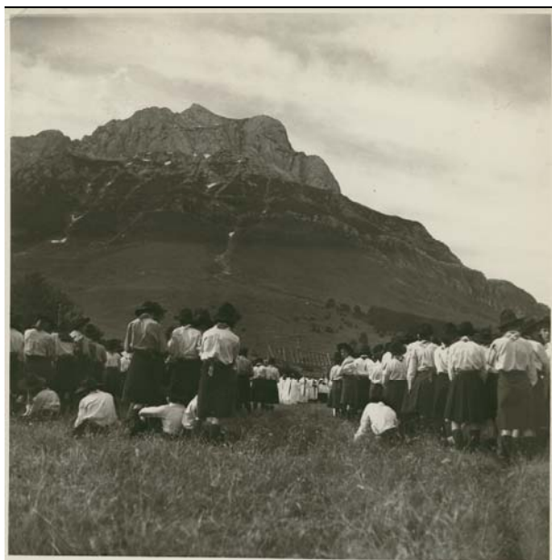
Route nazionale scolte, Lago di Como 1957

Materiale preparatorio e libretto dell'incontro; relazioni sulla sperimentazione dei cerchi pilota.