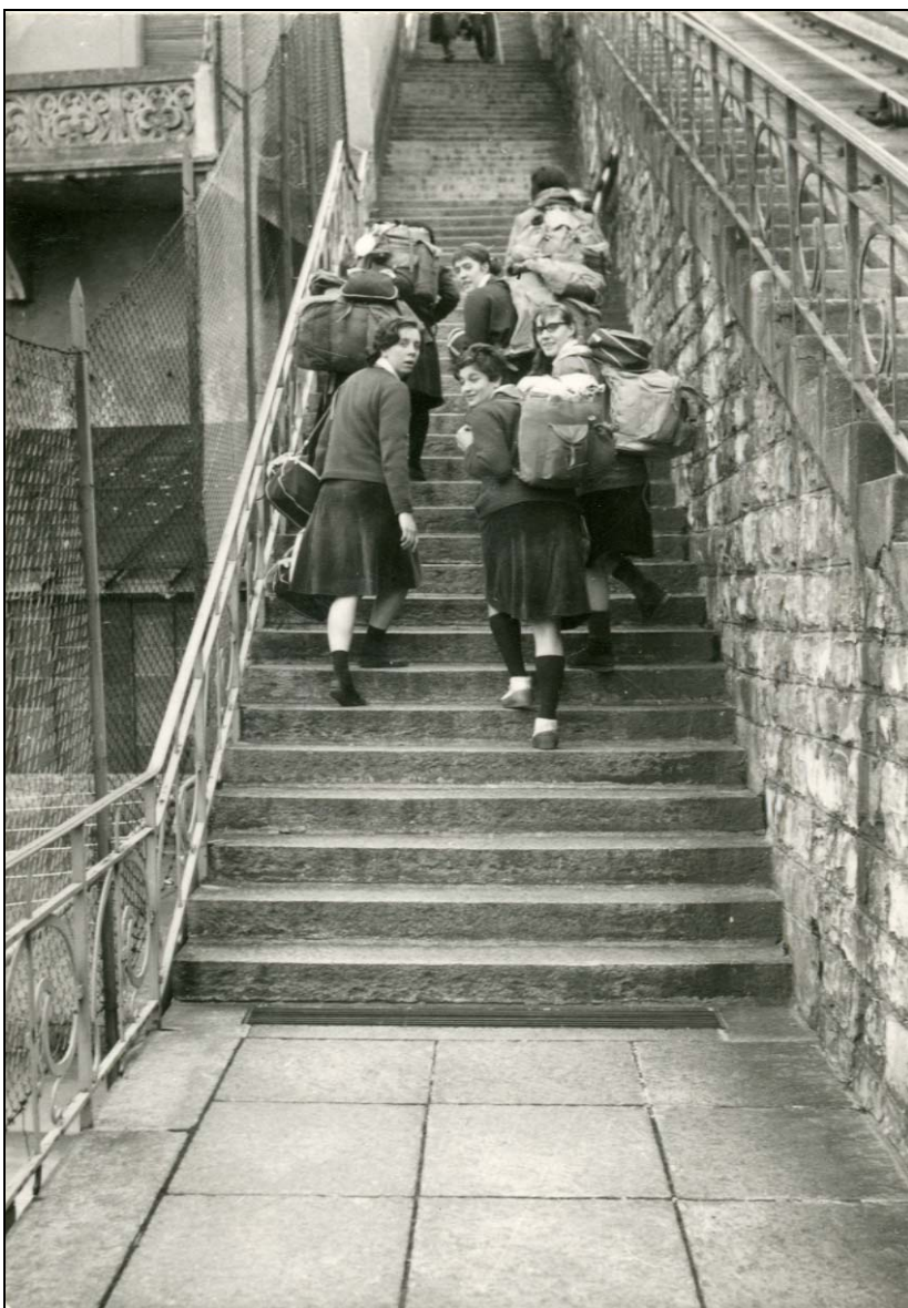
Fuoco in route, Trentino, anni '60