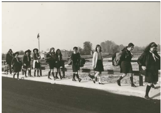
Riparto di Totò Pratesi in marcia, primi anni '60