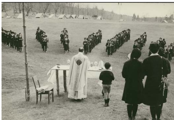
S. Messa al campo di un raduno di Riparti Agi, anni '60

Potrebbe trattarsi di "Article Un - Roman scout", pubblicato nel 1936.