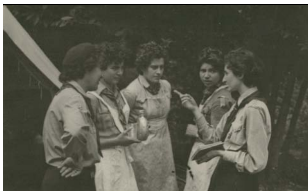
Scolte e Capo in attività al campo di formazione, anni '50

Cartoline, stampati, dépliants, quaderni, tessere, onorificenze, distintivi, oggetti (anche di stoffa).