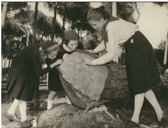
Una Guida e due Coccinelle in attività natura, Roma, anni '60