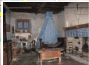
Camera di santa Bernadette nella casa della sua nutrice a Bartrès, chiamata maison Burg.