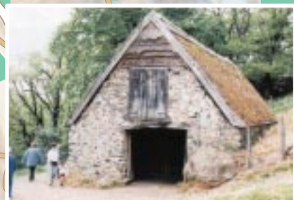
L'ovile di Bartrès