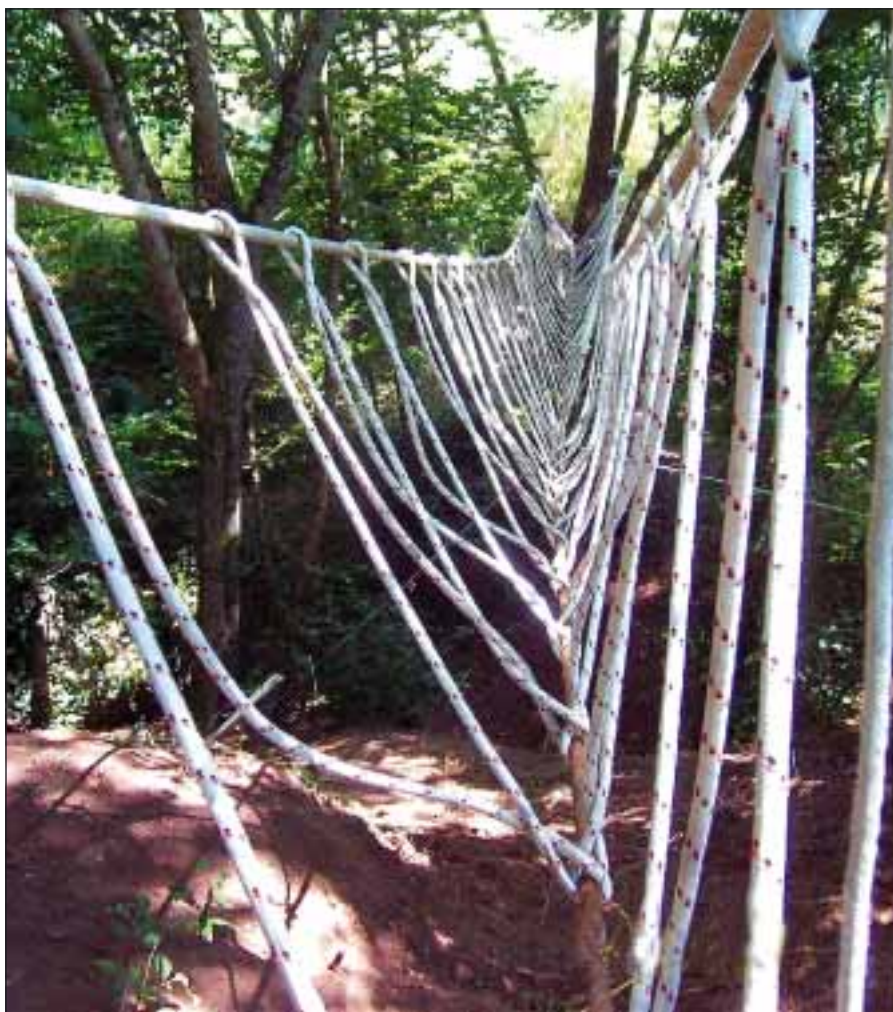
Rispetto delle regole, un percorso non sempre facile ma ricco di soddisfazioni

"Chi è orfano di diritti è straniero in terra dei doveri" scrive don Luigi Ciotti nella presentazione de Il piacere della Legalità e continua "solo i diritti rispettati e praticati educano a quei doveri che rendono meno ingiusta la nostra società", infatti se i bisogni fonda-