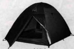
Tenda Mito 3