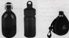
Borraccia etagapelle Isacco. Borraccia cilindrica. Borraccia fiaschetta panna.