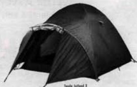
Tenda Inland 2