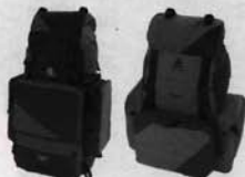
Zaino Yukon 80 lt. Zaino Dakota 45 lt.