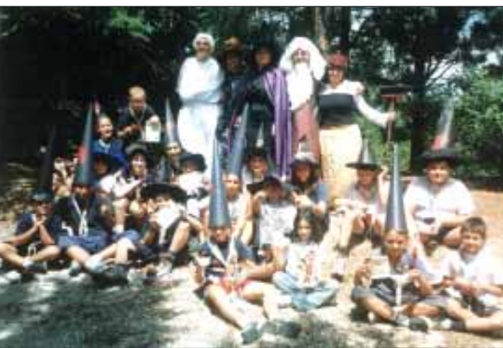
Un super-grazie ai giornalisti del Branco "Valle di Seeonee" Spoleto 1, che ci hanno raccontato le loro VdB!

Illustrazioni e grafica: Vittorio Belli • Impaginazione: Simona Pasini