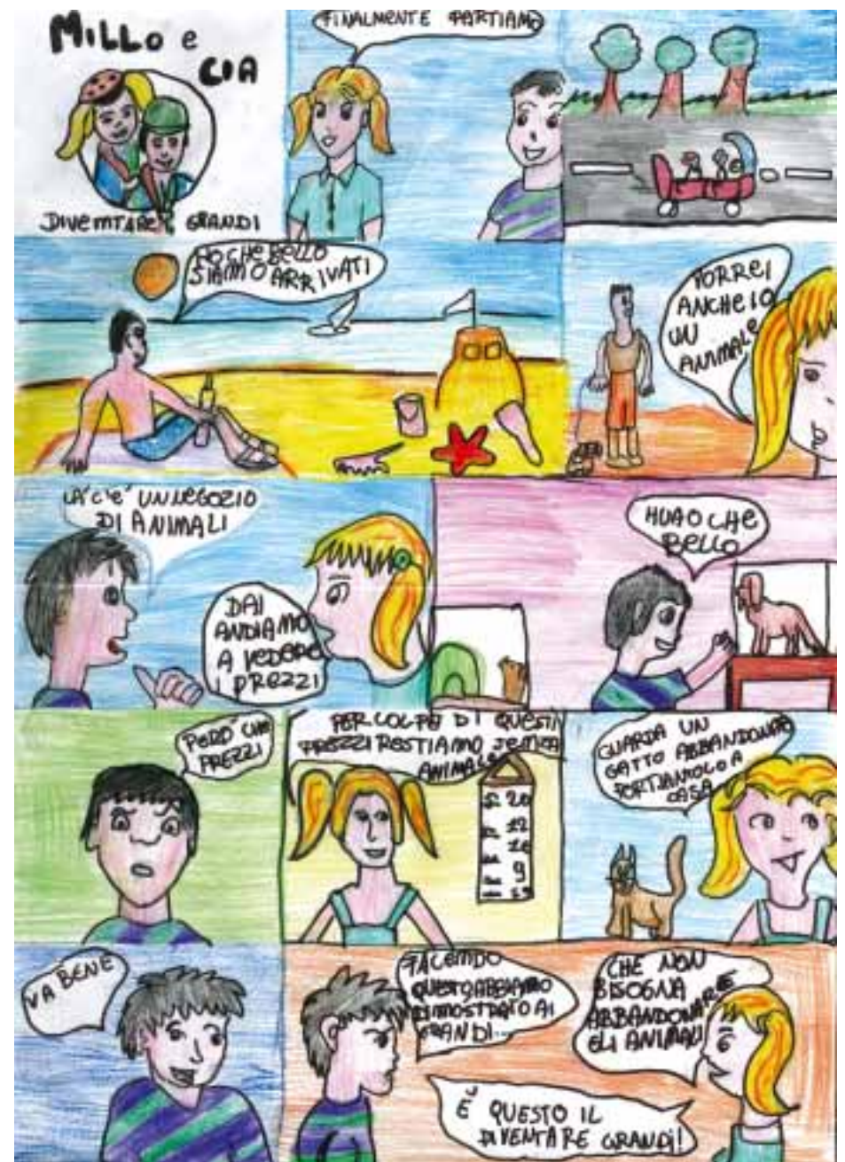
Tania D. - S.Giustina in Colle 1 (Padova)