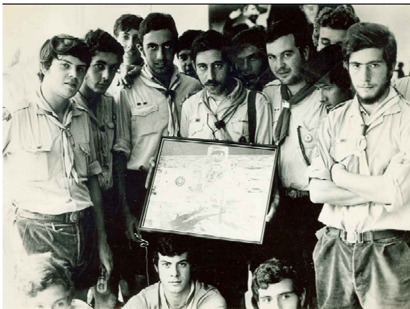
Giovanni Morello mostra la foto del primo allunaggio: Armstrong con il vessillo Wosm, dopo il luglio 1969