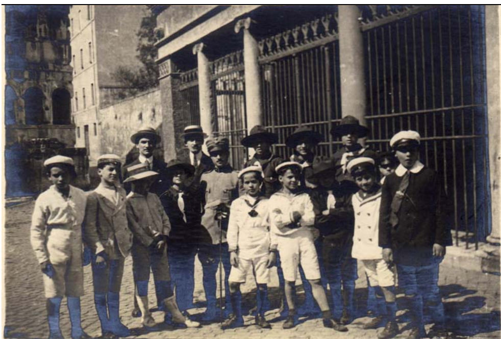
Gruppo con scout davanti a S. Giorgio al Velabro, Roma, 1923

Titolo di M. Sica: "I campo scuola dell'Asci".