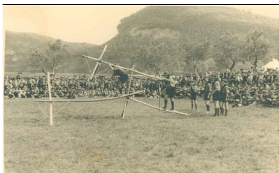
San Giorgio regionale, Lazio, anni '60

A stampa: notiziari del Segretariato nazionale del Movimento adulti scouts cattolici italiani (Masci), nn. 1, 3, 4-5, 7 e 8; Masci, Annuario 1970 , 1970.