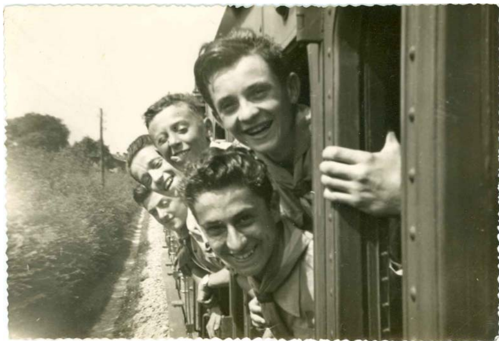
Estote parati, verso il futuro, anni '60