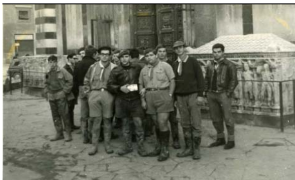
Rovers del Parma V a Firenze per aiuti dopo l'alluvione, novembre 1966

Circolari e corrispondenza con il Ministero dell'interno relative al servizio ausiliario di protezione civile.