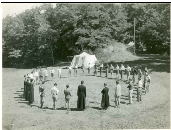
Capi e assistenti in cerchio, anni '60

I componenti del Commissariato centrale nominano in seno allo stesso un presidente, e si ripartiscono fra loro la direzione e la responsabilità delle singole attività. I commissari centrali riferiscono periodicamente al Commissariato centrale sull'andamento del settore di loro competenza.