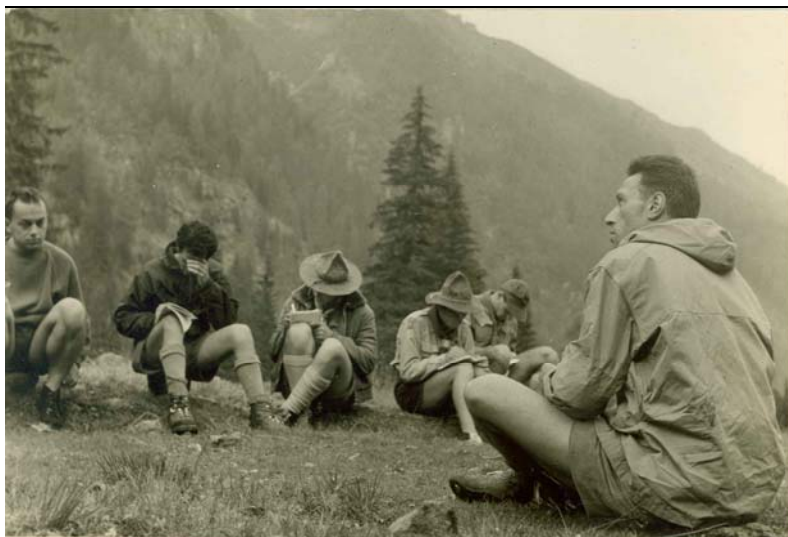
Campo di formazione per capi, anni '60

Due rubriche e cinque quaderni manoscritti con l'elenco dei capi che hanno ricevuto le onorificenze dei gigli di benemerenzza di I, II e III classe, delle croci al valore e delle aquile d'argento. Modulistica per il conferimento dei gigli di beneficenza.