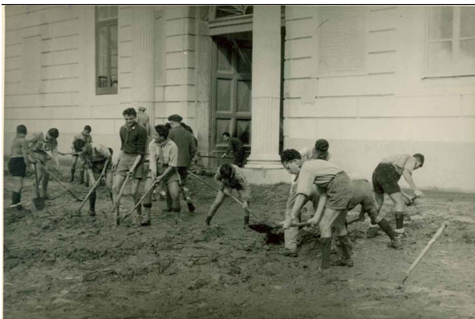
Rover in servizio, alluvione in Campania, 1954

Questionari relativi alla tipologia di Clan (compilati).