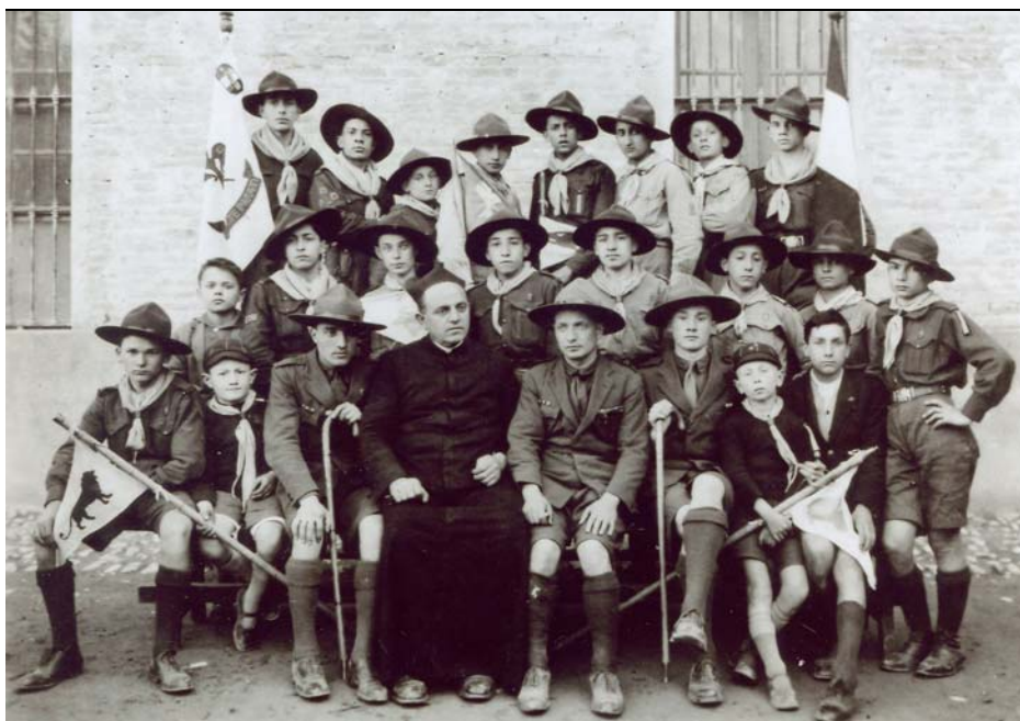
Riparto Parma V, 1926. Sulla fiamma si nota l'emblema dell'Opera nazionale balilla

Utilizzati vecchi fogli della Fasci (Federazione delle associazioni sportive cattoliche italiane).