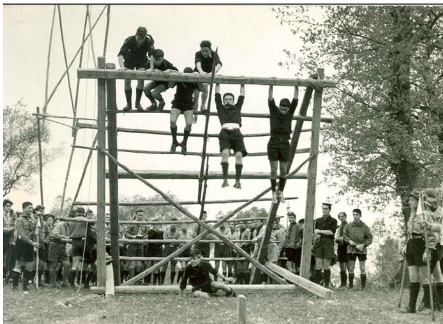
Salute e forza fisica, esercizi al quadro svedese (costruzione scout), anni '60

Corrispondenza del Commissariato centrale con il Comitato permanente forniture, con i commissariati regionali, con i responsabili delle rivendite ufficiali scout e con i singoli capi relativamente all'istituzione del consorzio.