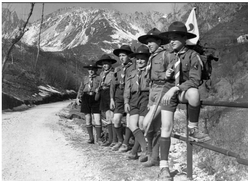
Squadriglia in uscita, anni '50