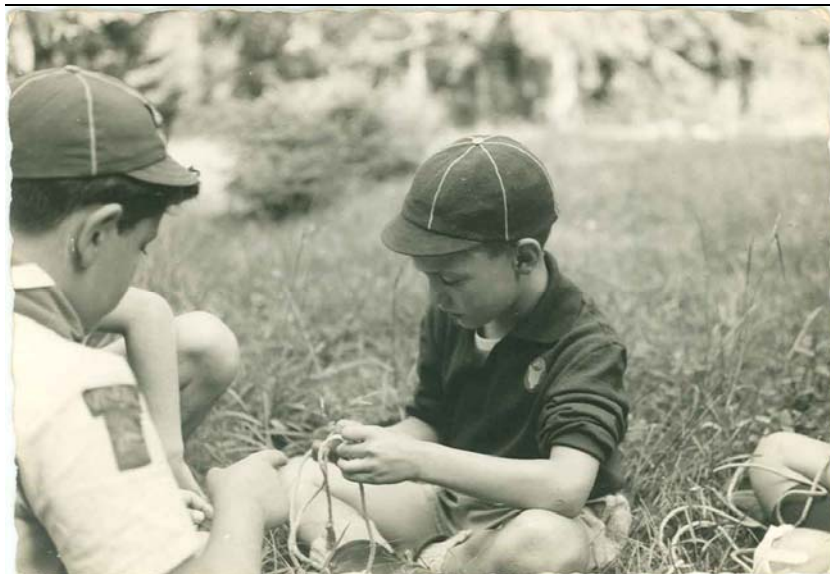
Lupetti imparano i nodi, anni '60