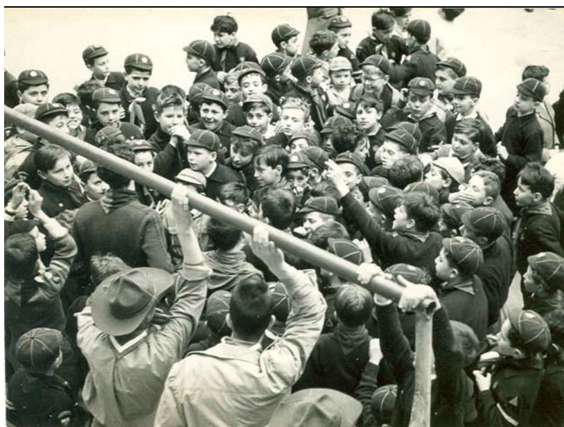
Lupetti in gioco, anni '60