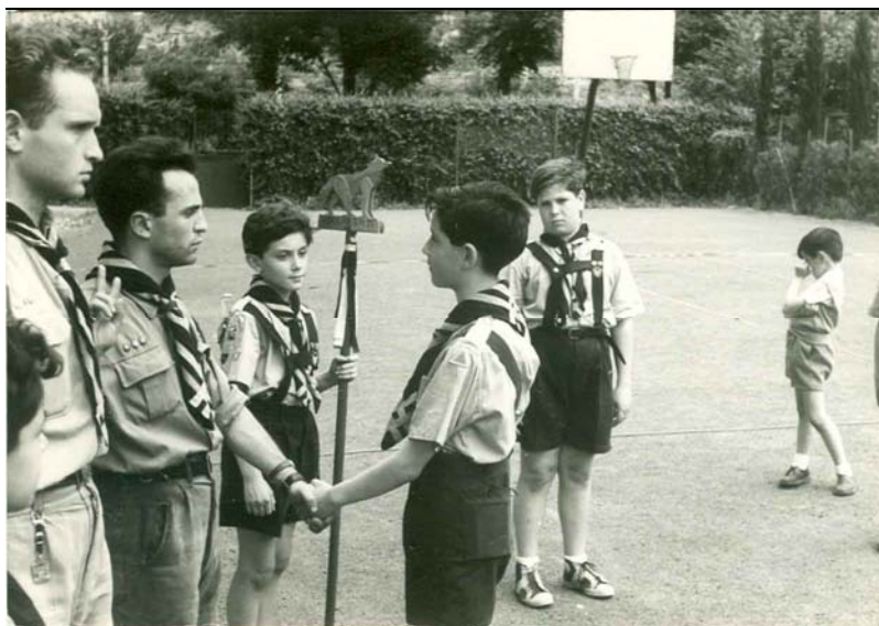
Promessa di un lupetto. anni '60