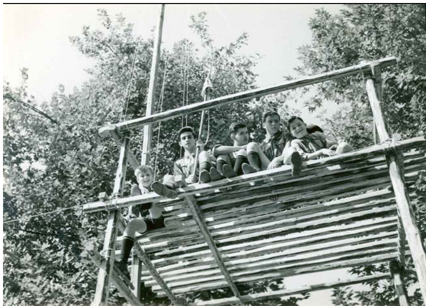
Costruzione sopraelevata di squadriglia, anni '60