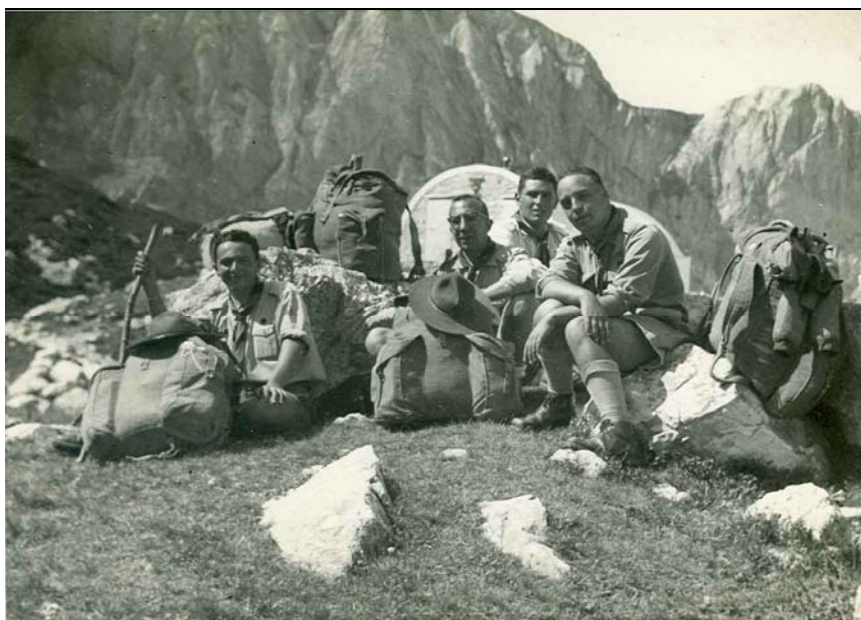
In route, anni '50

Corrispondenza e documentazione diversa (programma, relazioni) relativa all'incontro degli assistenti ecclesiastici nazionali delle associazioni europee di scout cattolici (Réunion des Aumôniers Européens) tenutosi a Parigi il 29-30 maggio del 1965 (il delegato italiano era monsignor Del Gallo).