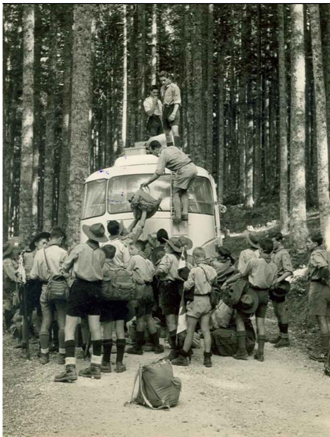
Arrivo al campo, anni '50