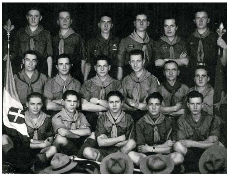
Le Aquile Randagie, Milano 1935

I documenti sono numerati da 1 a 157 e seguono un andamento cronologico; mancano i documenti 4, 8, 11, 46, 47, 56, 73, 78, 85, 110, 114, 115, 119, 122, 123, 124, 126, 143, 150, 156.