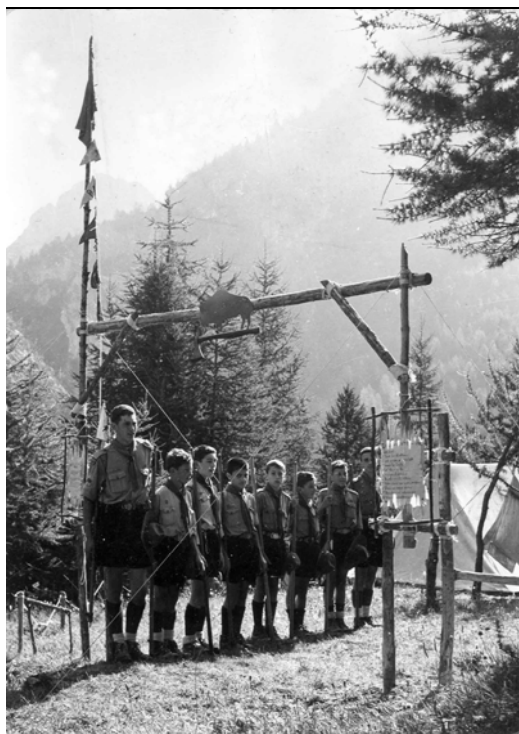
La squadriglia schierata saluta al proprio portale, anni '50

Dattiloscritto con annotazioni manoscritte di un quaderno sul gioco come mezzo per la formazione e l'educazione dei ragazzi.