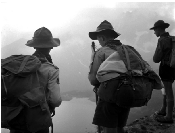
Hike di squadriglia, Cinisello I, anni '50

Circolari in merito all'emissione del primo francobollo italiano a soggetto scout (23 aprile 1968).