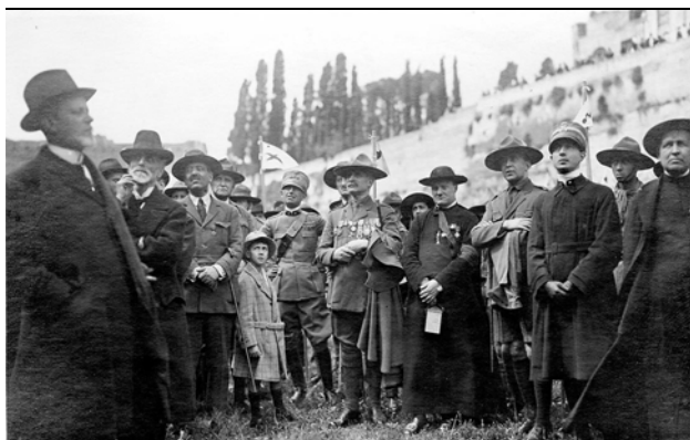
Raduno scoutistico al Palatino, Roma, 1923

Rubrica, su modello di un copialettere, con indirizzi incollati su pagine bianche. L'indirizzario è suddiviso per regioni.